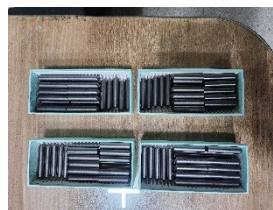
<Steel Stylus Pin>